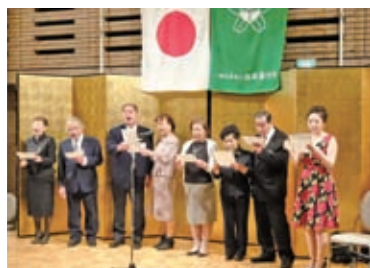
善行会の歌 (芸能奉仕団)