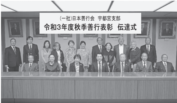
(一社)日本善行会 宇都宮支部 令和3年度秋季善行表彰 伝達式

その後 支部長の進行で、受賞者それぞれから満面の笑みで受賞の喜びと活動内容のコメントがありました。特に、コロナ禍の中、様々な活動が制約される中でも地域での絆づくりや環境保全などに真摯に取り組み姿に、参加役員五名を初め、一同充実感にあふれ更なる活動を誓い合いました。次年度は、明治神宮での表彰式になることを祈りつつ……。