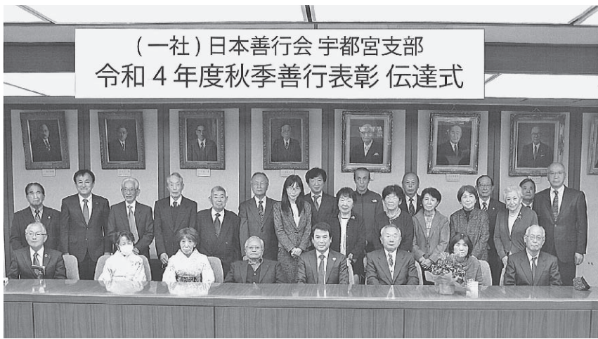
(一社)日本善行会 宇都宮支部 令和4年度秋季善行表彰 伝達式

絆づくりや環境保護に力を合わせることを誓い合いました。なお、受賞者祝賀会は、恒例の総会時に会員登録者対象で開催することを伝達しました。